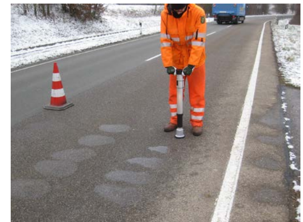
Restsalzmessung auf Landstraßen (ISE)