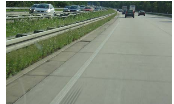
Beispiel für unterhaltungsfreundliche Gestaltung