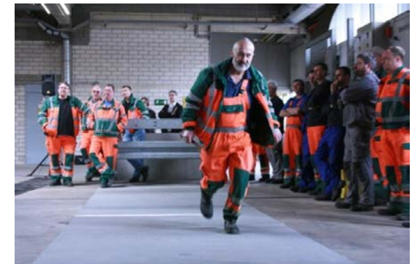
Eindruck aus Risiko-Parcours (Straßen.NRW)